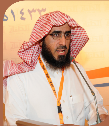
الشريف فضيلة الشيخ/ محمد بن صالح الطيار