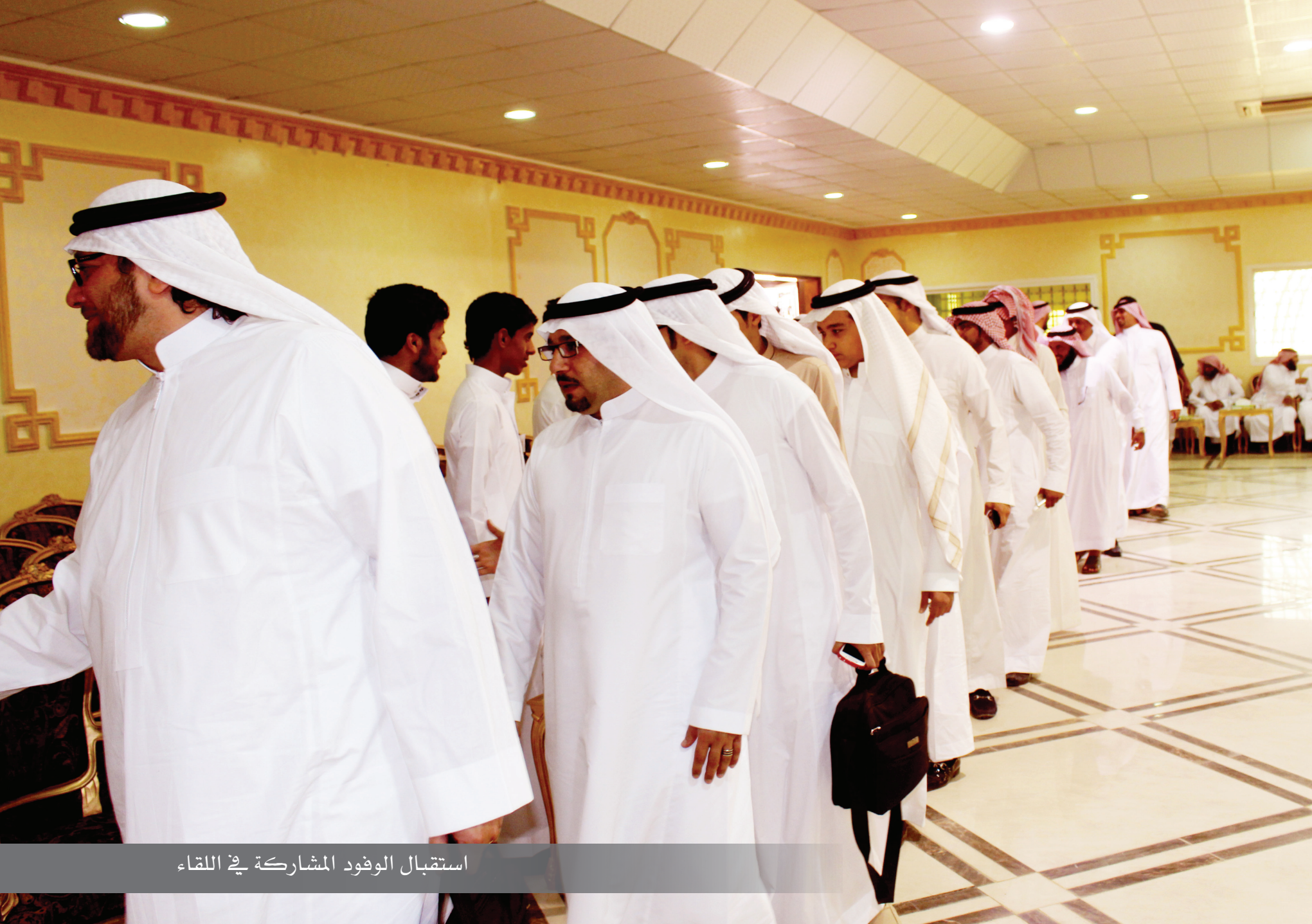
استقبال الوفود المشاركة في اللقاء