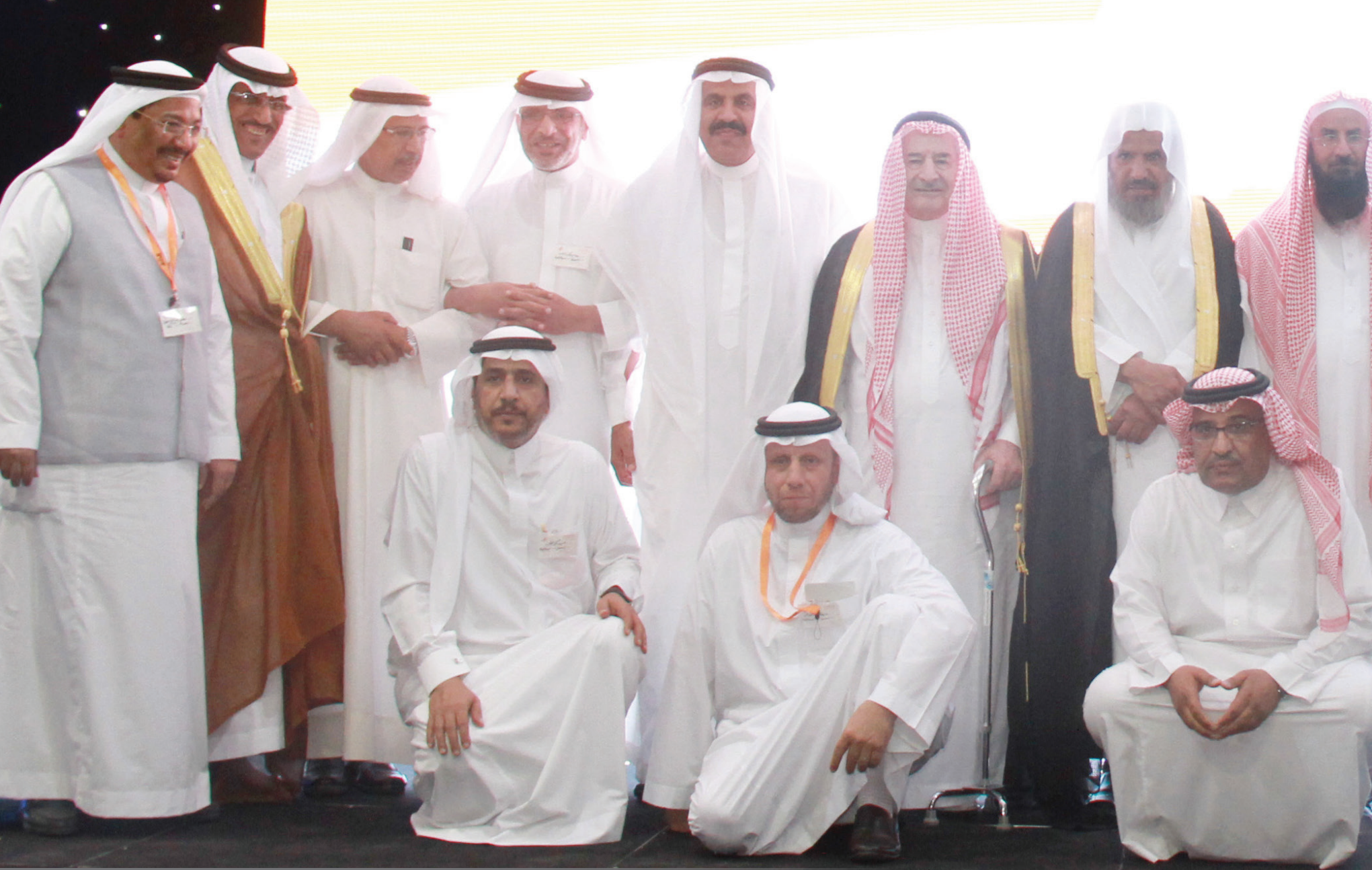
جانب من التكريم