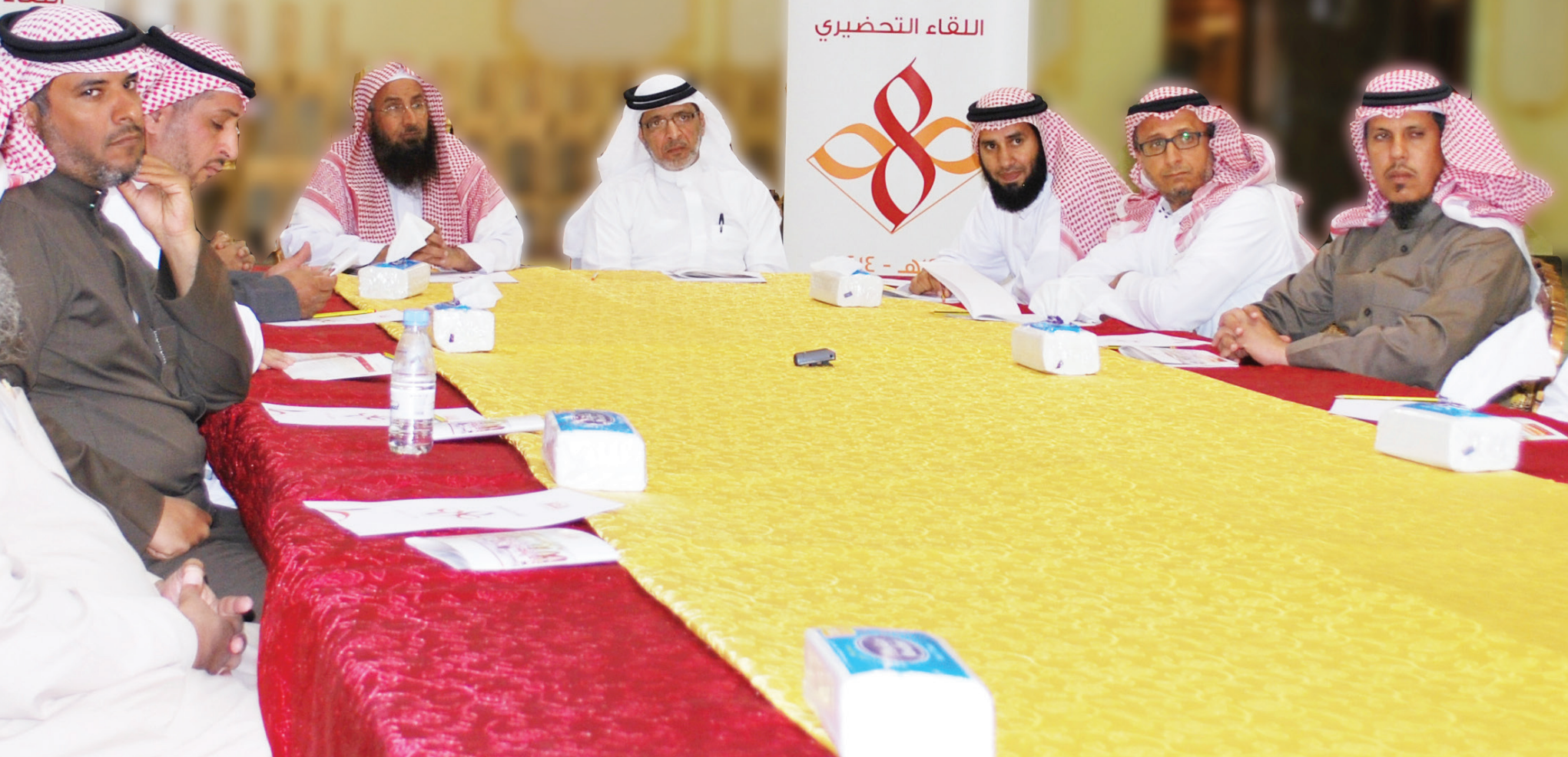
أثناء أحد الاجتماعات التحضيرية