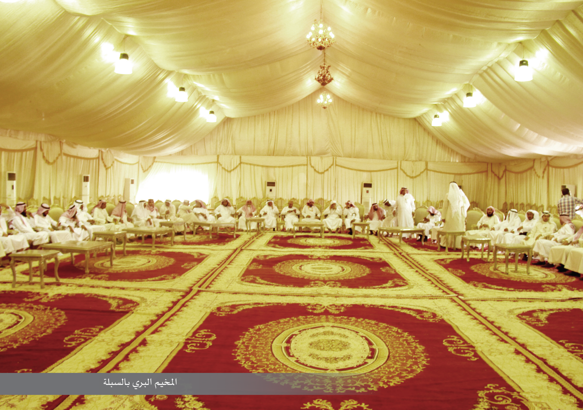
المخيم البري بالسبلة