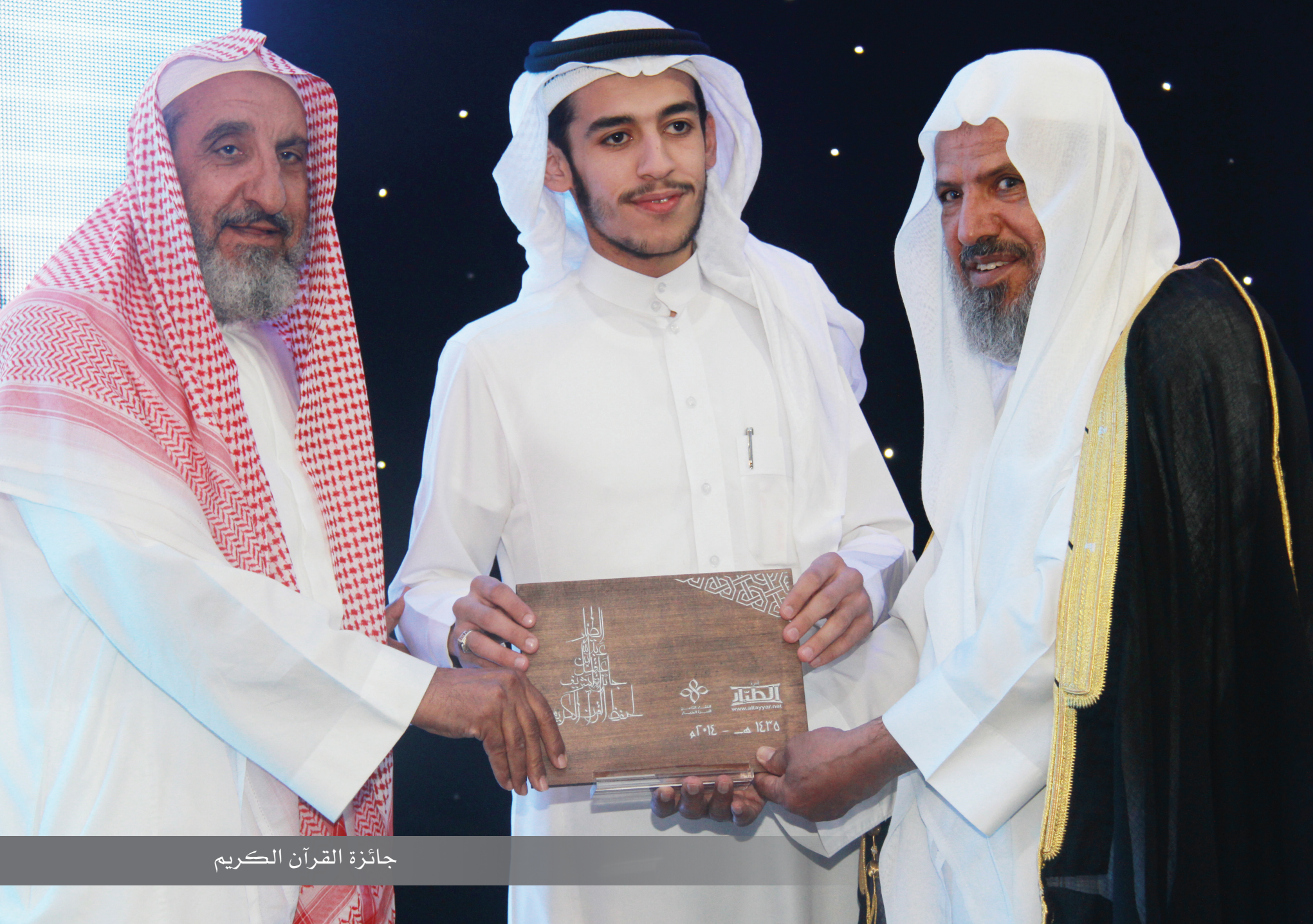
جائزة القرآن الكريم