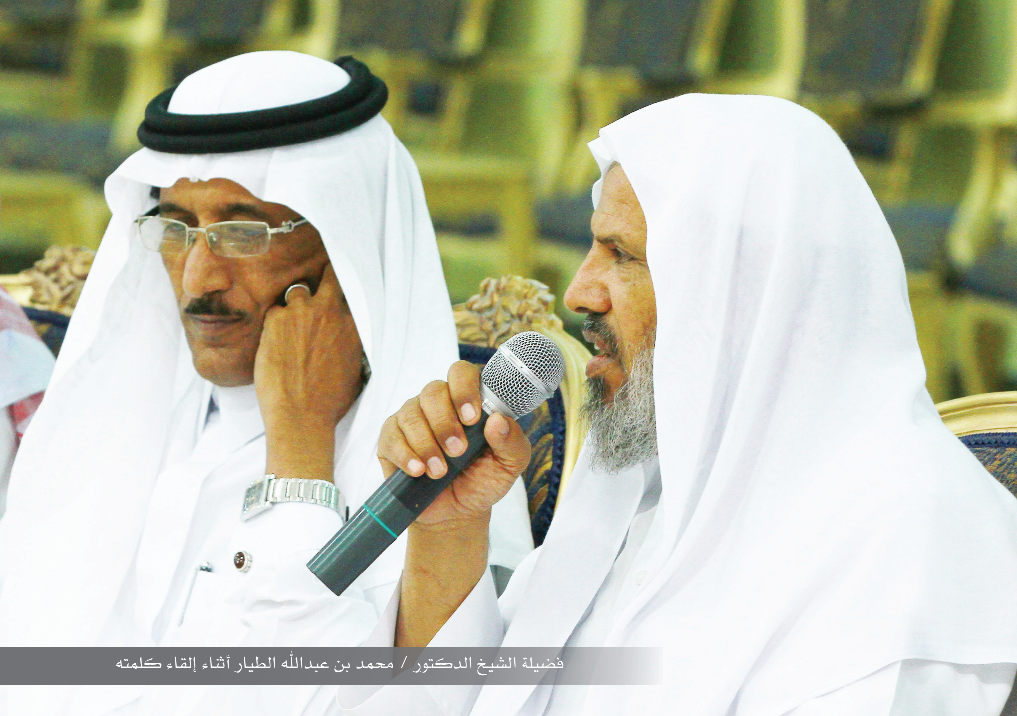
فضيلة الشيخ الدكتور / محمد بن عبدالله الطيار أثناء إلقاء كلمته