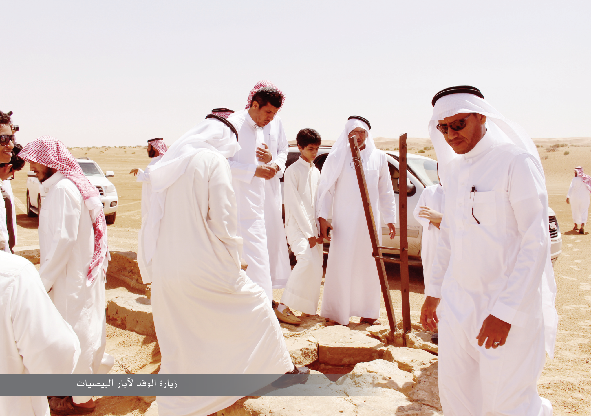
زيارة الوفد لآبار البيصيات