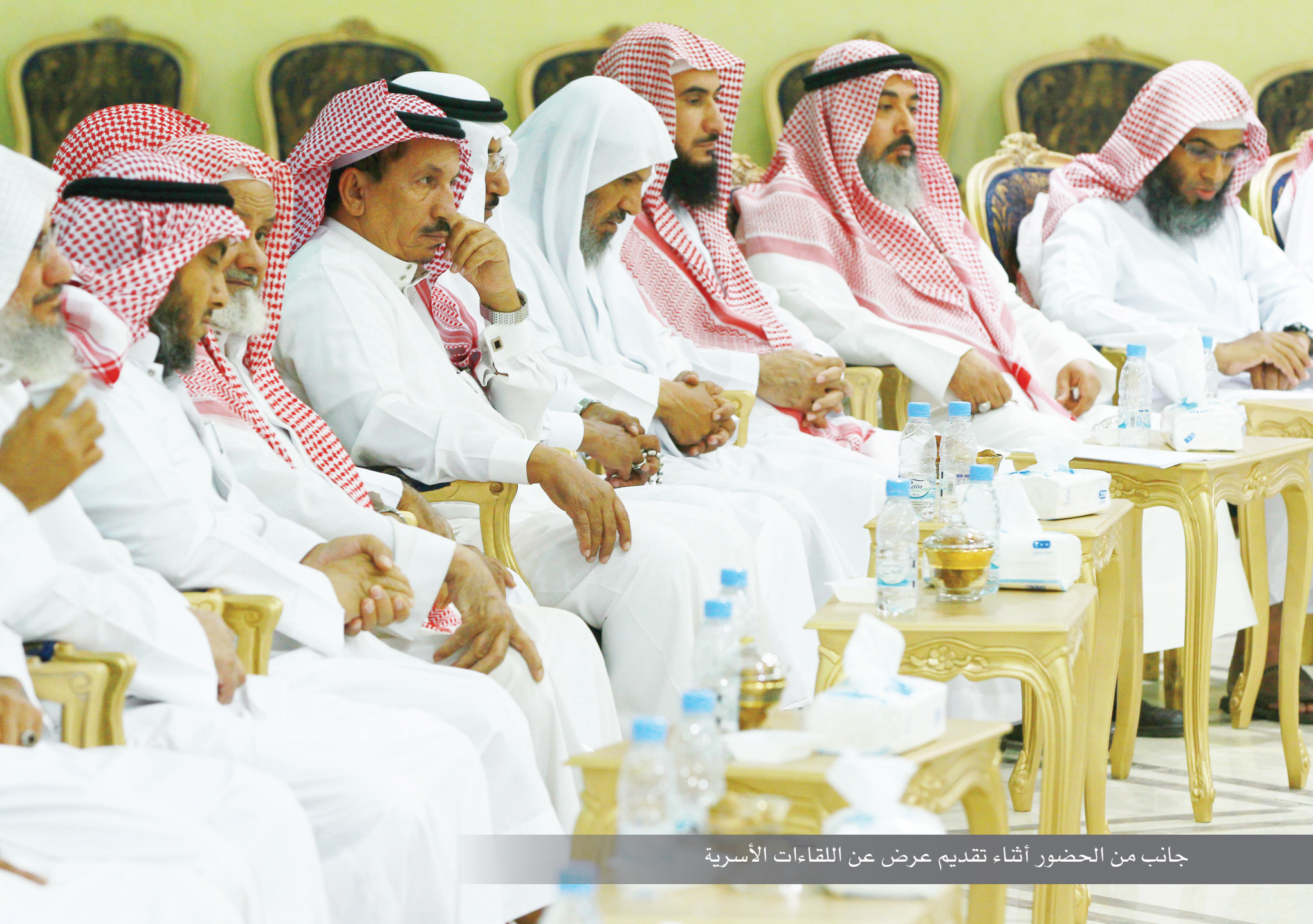
جانب من الحضور أثناء تقديم عرض عن اللقاءات الأسرية