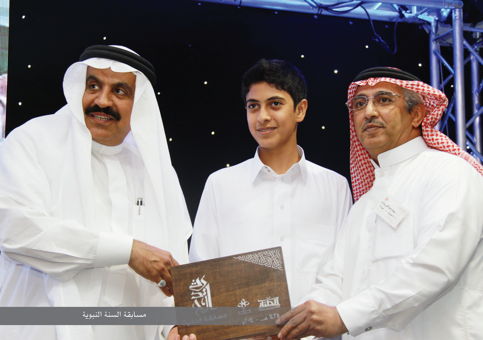
مسابقة السنة النبوية