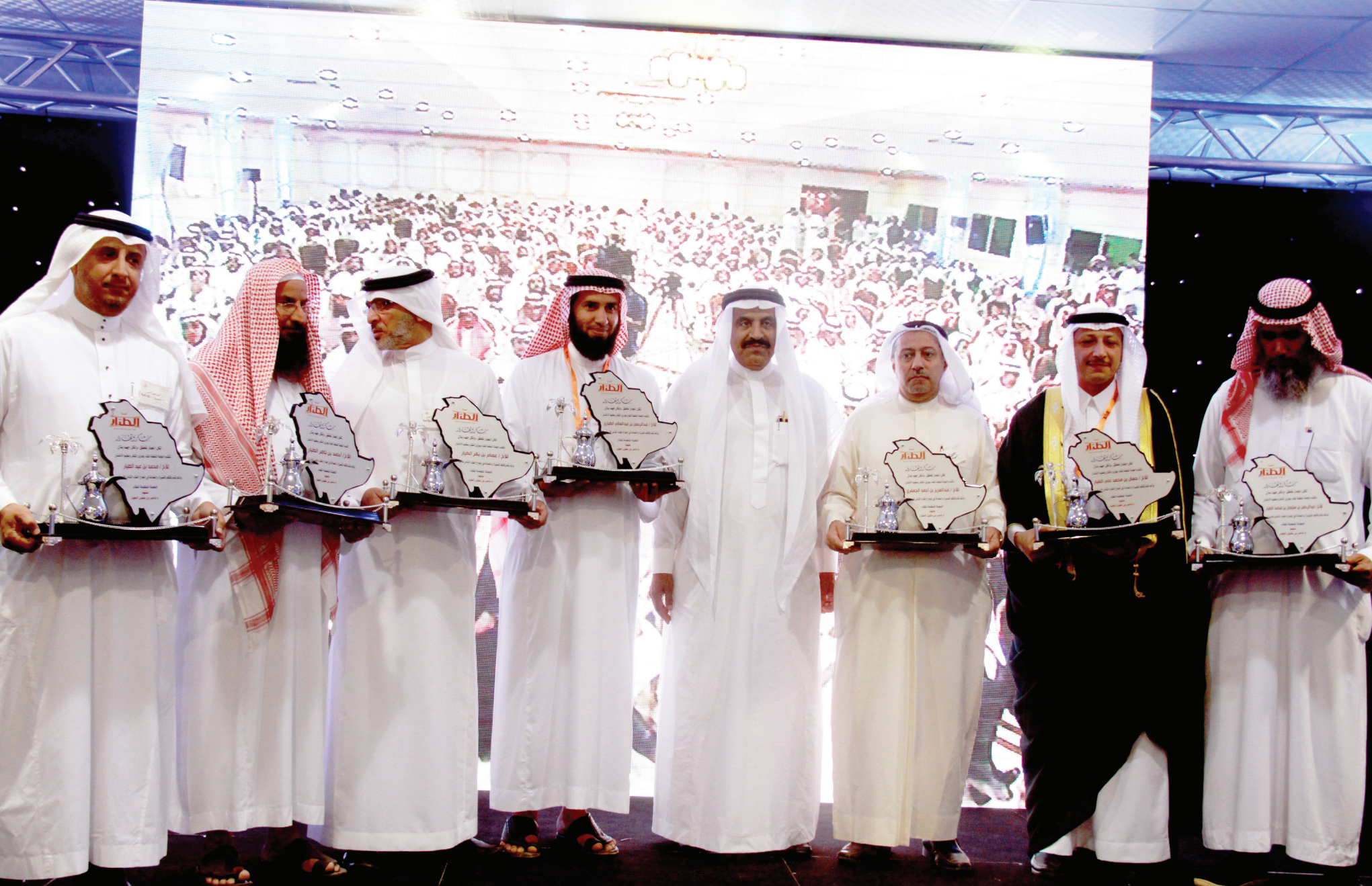
تكريم بعض من أبناء الأسرة