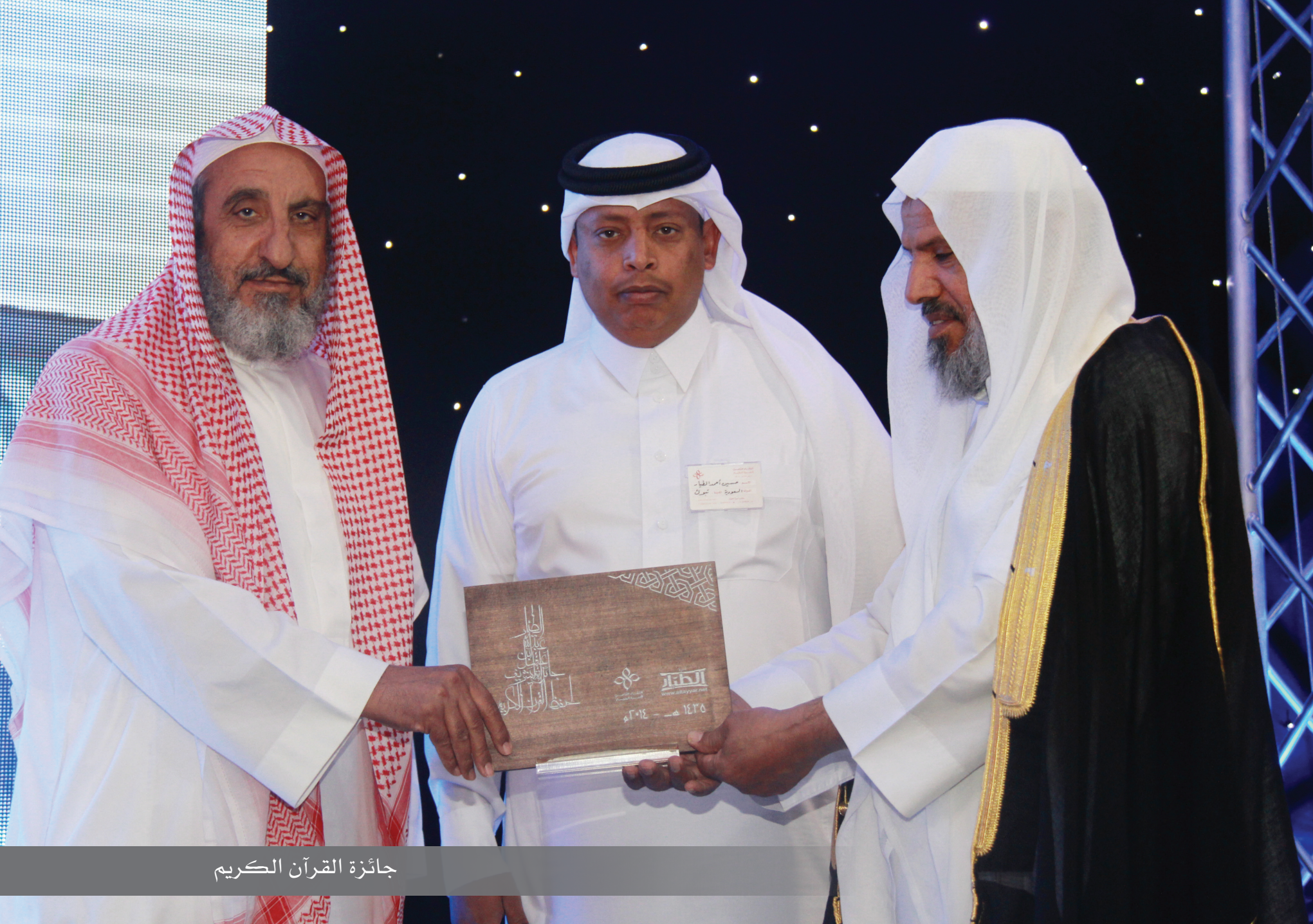
جائزة القرآن الكريم