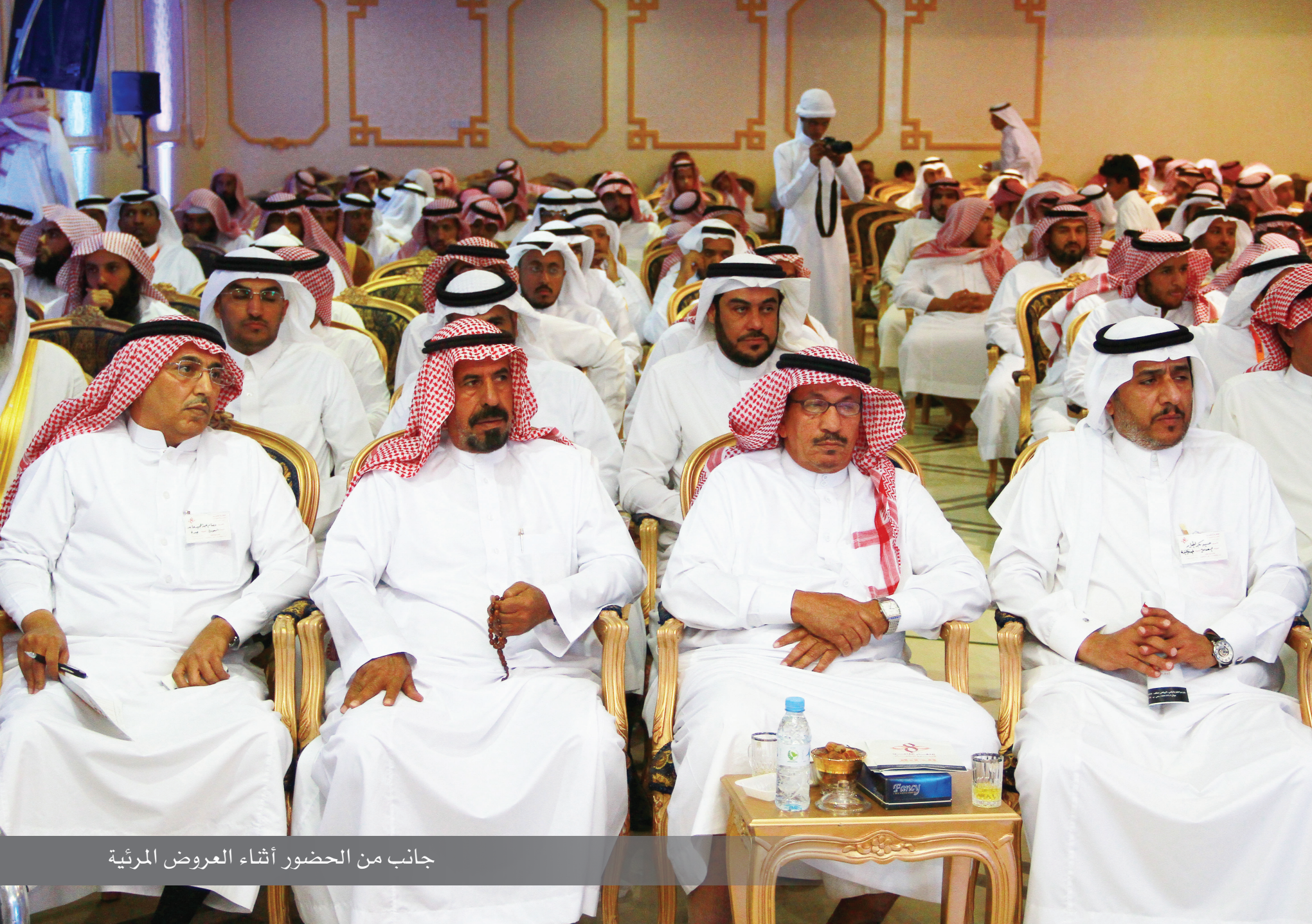
جانب من الحضور أثناء العروض المرئية