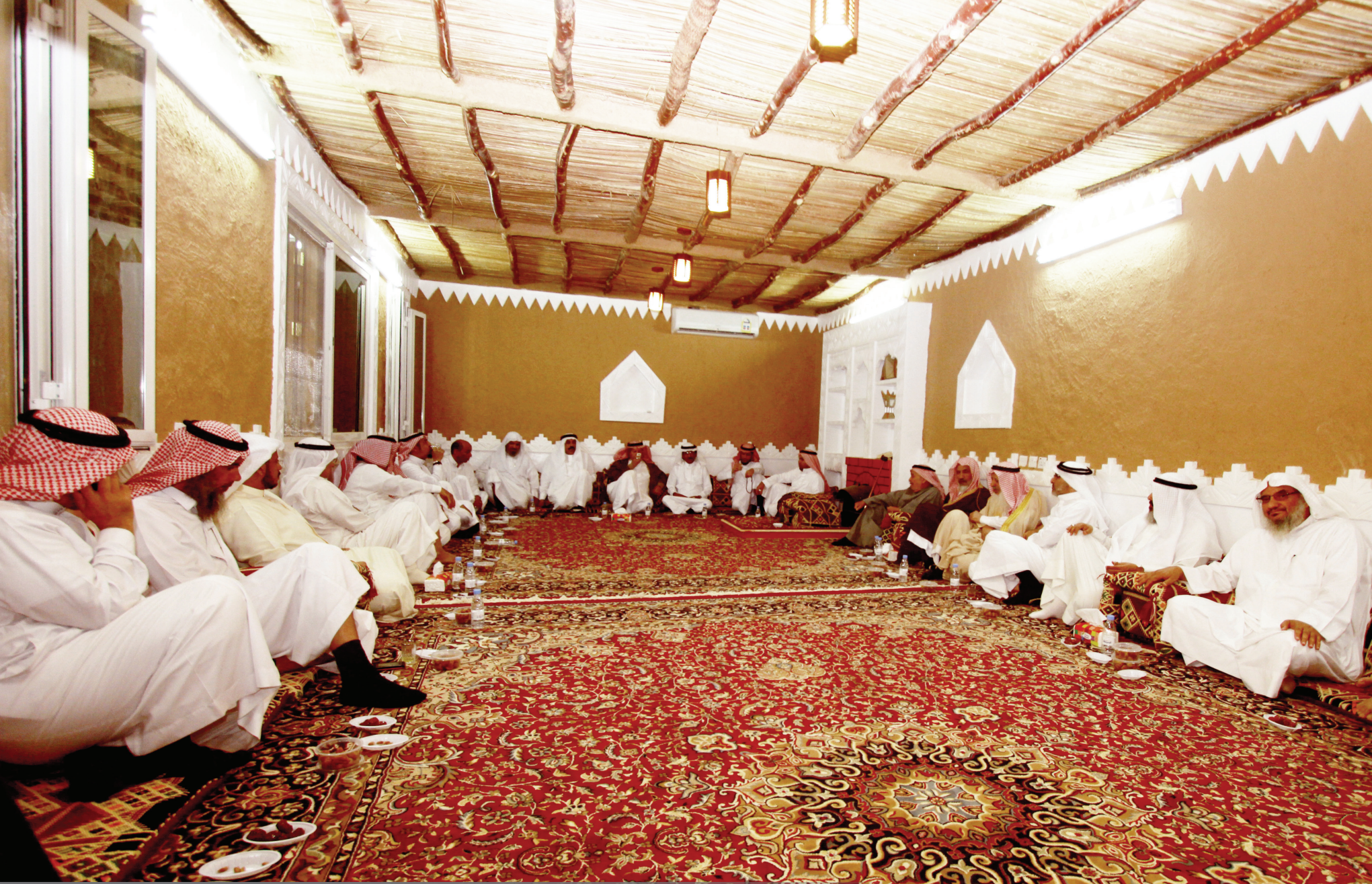
زيارة الشيخ / عبدالله بن عبدالعزيز الطيار