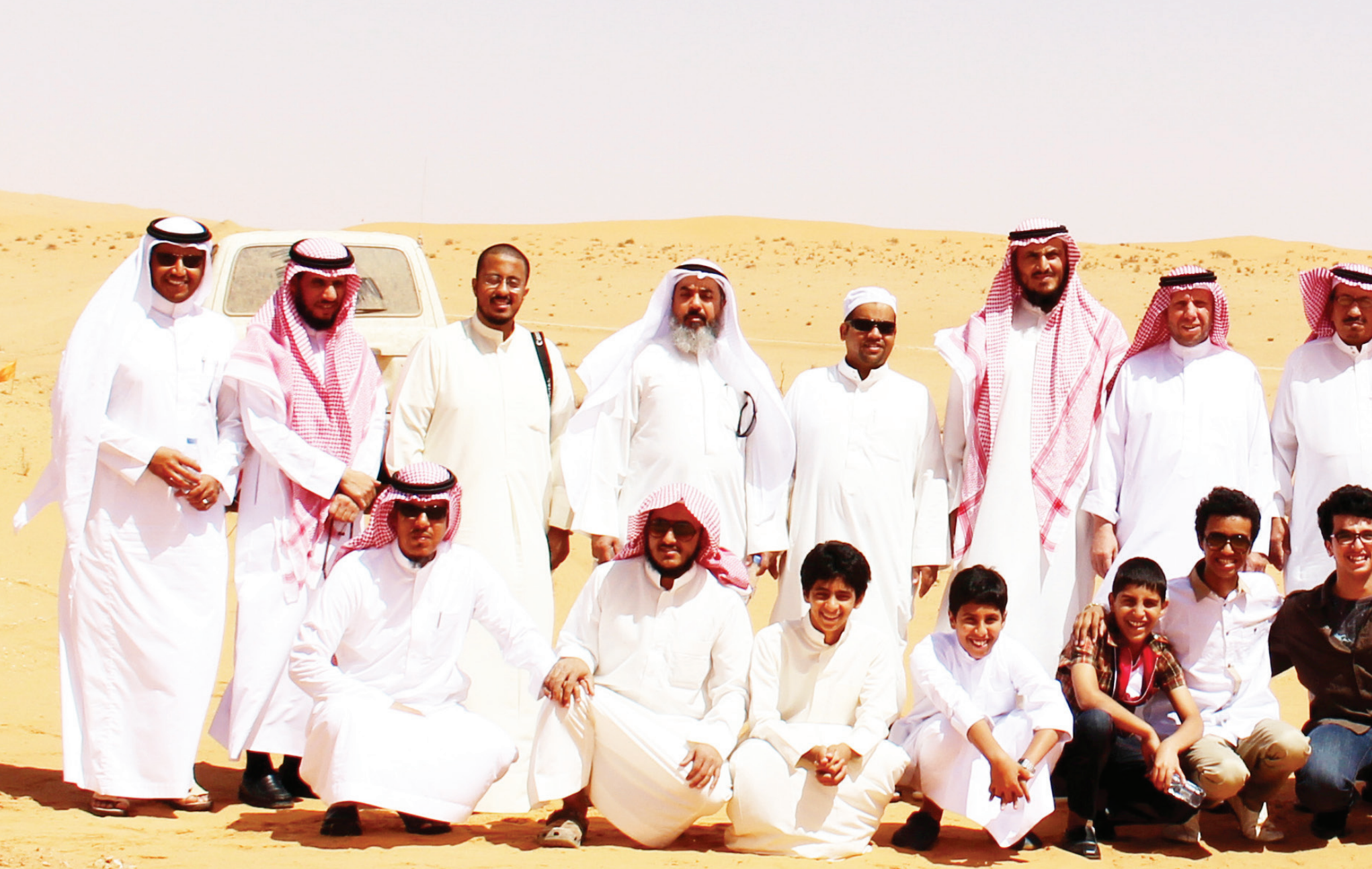
زيارة الوفد لأبار البيصيات