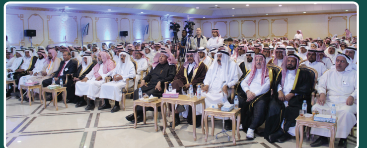
الزلفي تحتضن اللقاء الثامن