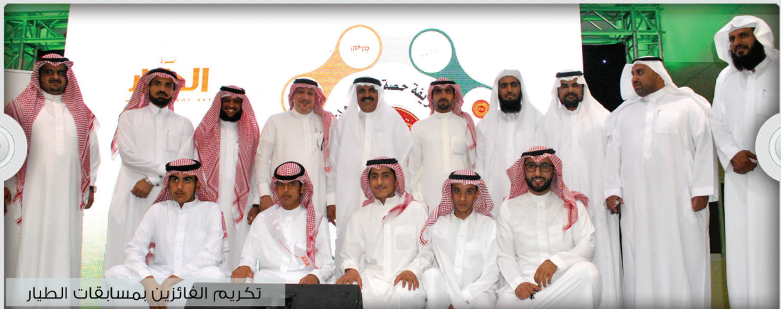
تكريم الفائزين بمسابقات الطيار