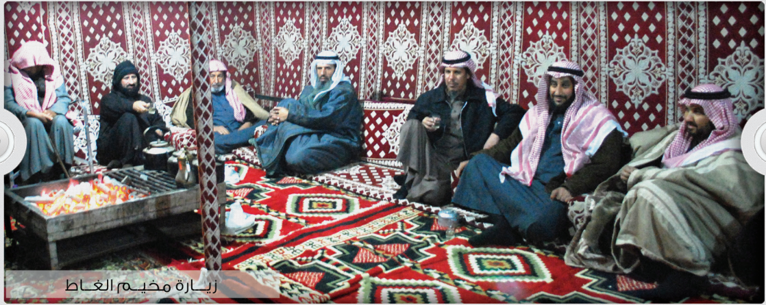
زيارة مخيم الغاط