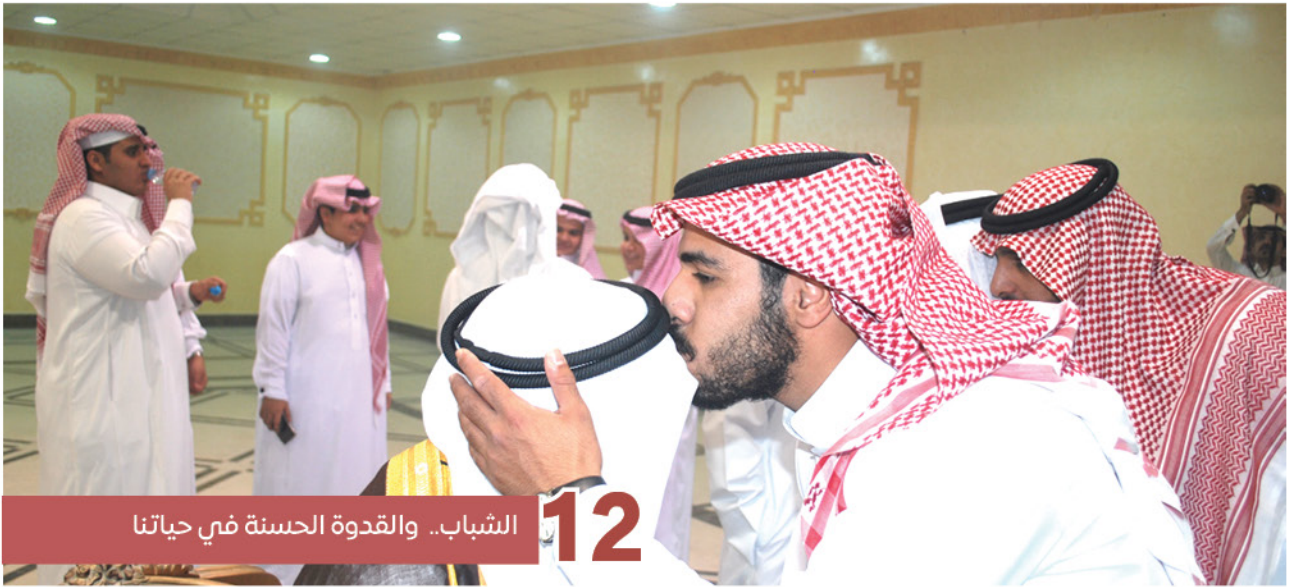
12 الشباب.. والقوة الحسنة في حياتنا