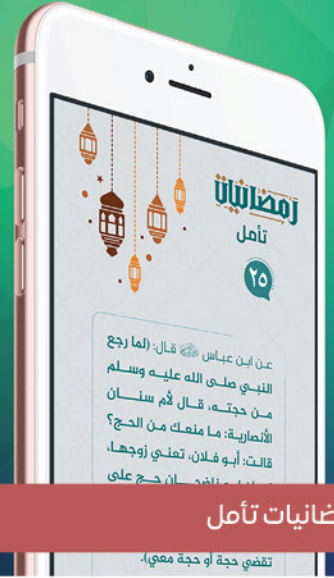
9 رمضانيات تأمل