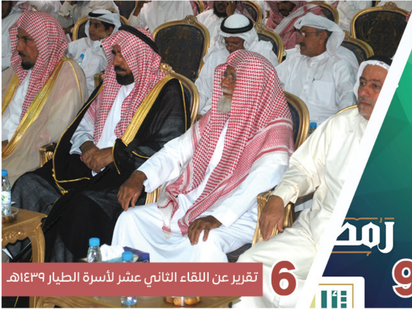
6 تقرير عن اللقاء الثاني عشر لأسرة الطيار ١٤٣٩هـ