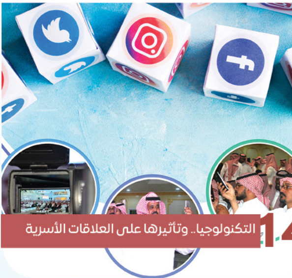
14 التكنولوجيا.. وتأثيرها على العلاقات الأسرية

الفائزون بجوائز مسابقات اللقاء الثالث عشر للأسرة